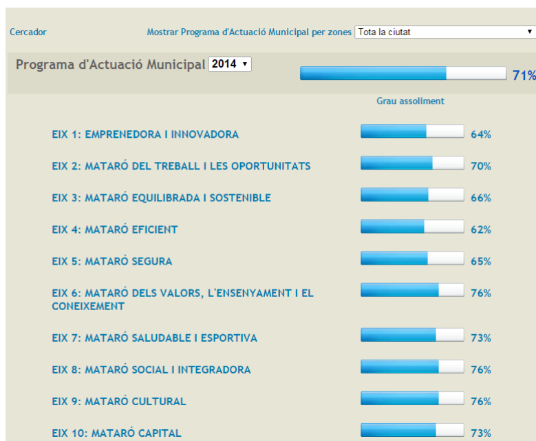
Figura 2. Seguiment del PAM a la Plana web de l'Ajuntament de Mataró